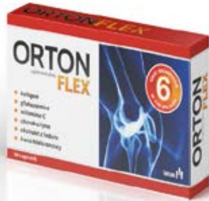
Dosierung: 646 mg × 30 Kapseln