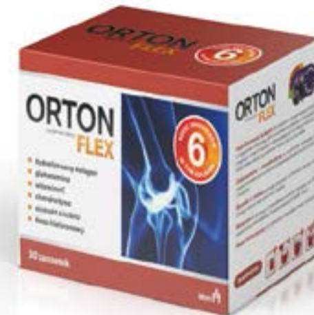
Dosierung: 11,48 g x 10, 30 Sachets