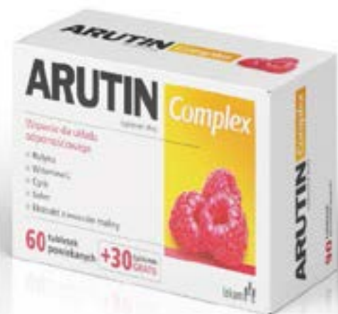
Dosierung: 366 mg x 90 Tabletten