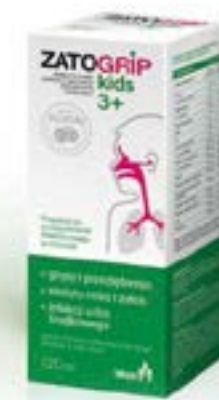
Dosierung: 120 ml Sirup

Die Bestandteile des Sirups helfen dem Körper, die entsprechende Funktion des Immunsystems aufrechtzuerhalten.