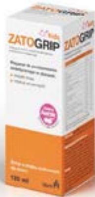
Dosierung: 120 ml Sirup