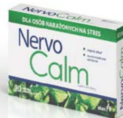
Dosierung: 620 mg x 10, 20 Tabletten