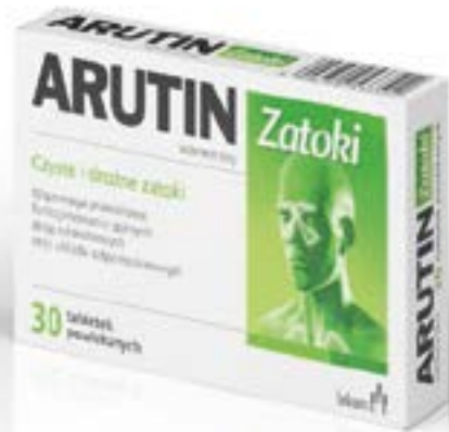
Dosierung: 210 mg x 30 Tabletten