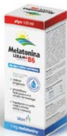
Flüssigkeit 120 ml