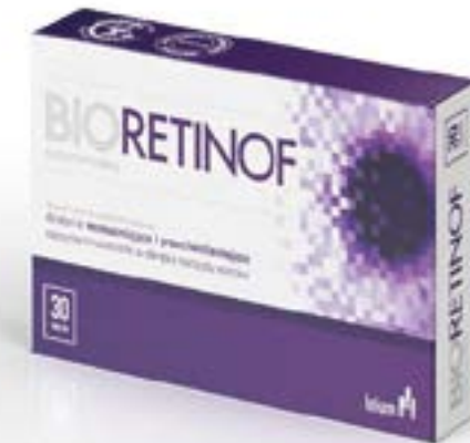
Dosierung: 852 mg x 30, 60 Tabletten